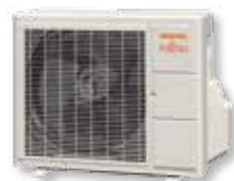
ASYG 7 à 12 LLCC