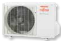
ASYG 9 et 12 LT