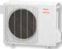
ASYG 18 LFC et 24 LFCC