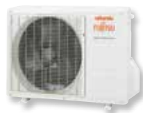
ASYG 7 et 9 LUC ASYG 12 et 14 LU