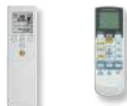
Infra-rouge (série) Infra-rouge (série) (Modèles LMC) (Modèles LFC)