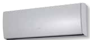
ASYG 9 et 12 LT

L'UNITÉ INTÉRIEURE, SA TÉLÉCOMMANDE ET L'UNITÉ EXTÉRIEURE