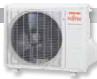
ASYG 7 à 14 LMC